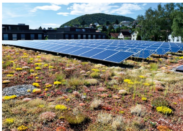
Abbildung 4: Extensive Dachbegrünung in Kombination mit PV-Anlage.

Wichtig, extensive Begrünungen sind nur im Rahmen der Instandhaltung begehbar. Sie dienen mit ihrer möglichst geschlossenen Vegetationsdecke in erster Linie als ökologischer Ausgleich überbauter Natur, insbesondere in stark versiegelten Räumen wie etwa Ballungsgebieten.