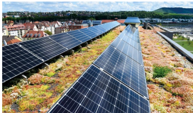
Abbildung 3: Photovoltaik und Gründach sind unmittelbar auf der selben Fläche verbunden. Hier sind die Module in eine Richtung ausgerichtet.

Grundsätzlich sollte bei der Kombination von PV und Gründach – die unmittelbar verbunden sind – ein niedriger Substrataufbau und entsprechend kleinwüchsige Bepflanzung realisiert werden. D.h. ein extensives Gründach, damit der Bewuchs keinen Schattenwurf erzeugt und der Pflegeaufwand möglichst gering bleibt.