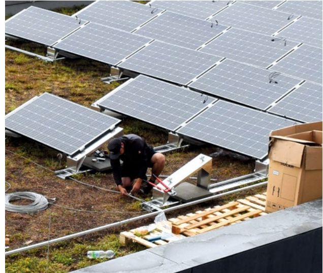
Abbildung 7: Montage einer PV-Anlage auf ein bestehendes Gründach.