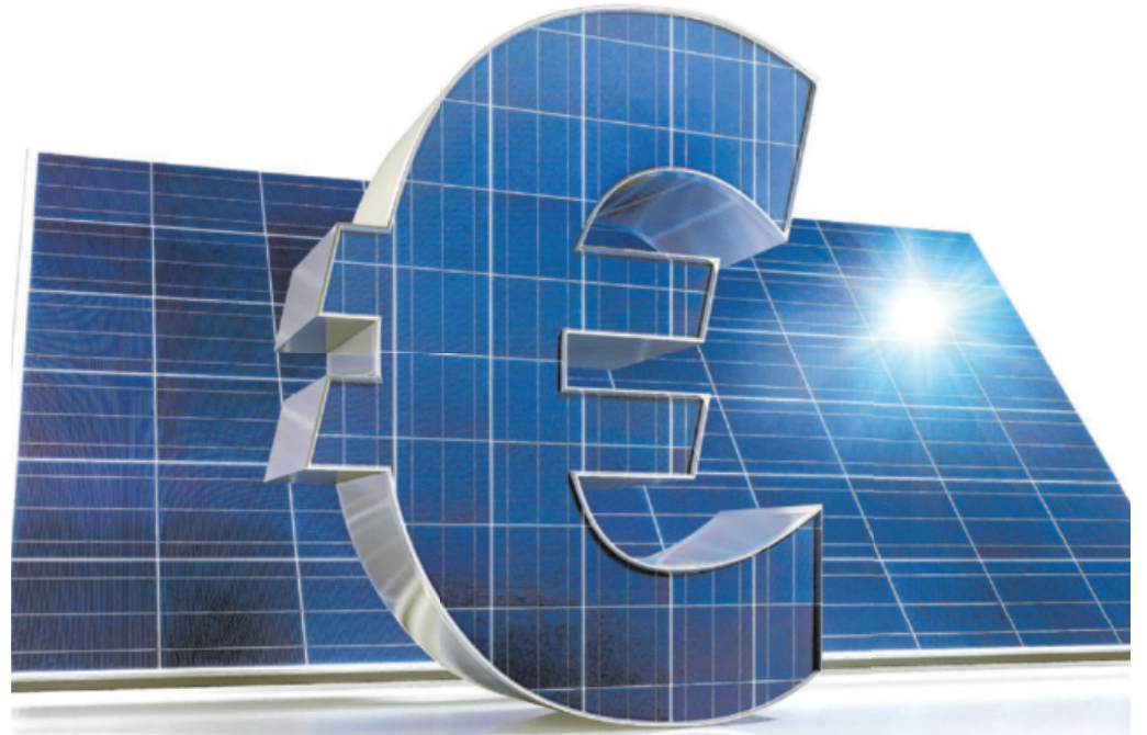
Erneuerbare Energien nutzen und wirtschaftlich erfolgreich sein – das ist schon längst kein Widerspruch mehr. Doch nachhaltiges Wirtschaften umfasst so viel mehr und hat neben der ökologischen auch eine soziale und ökonomische Komponente.

gehen und Top-Unternehmer wie Larry Fink, Chef des Vermögensverwalters „BlackRock“, von der Wirtschaft mehr Einsatz gegen den Klimawandel fordert.